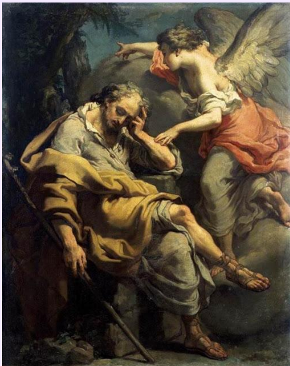
El sueño de San José. Gaetano Gandolfi. 1790